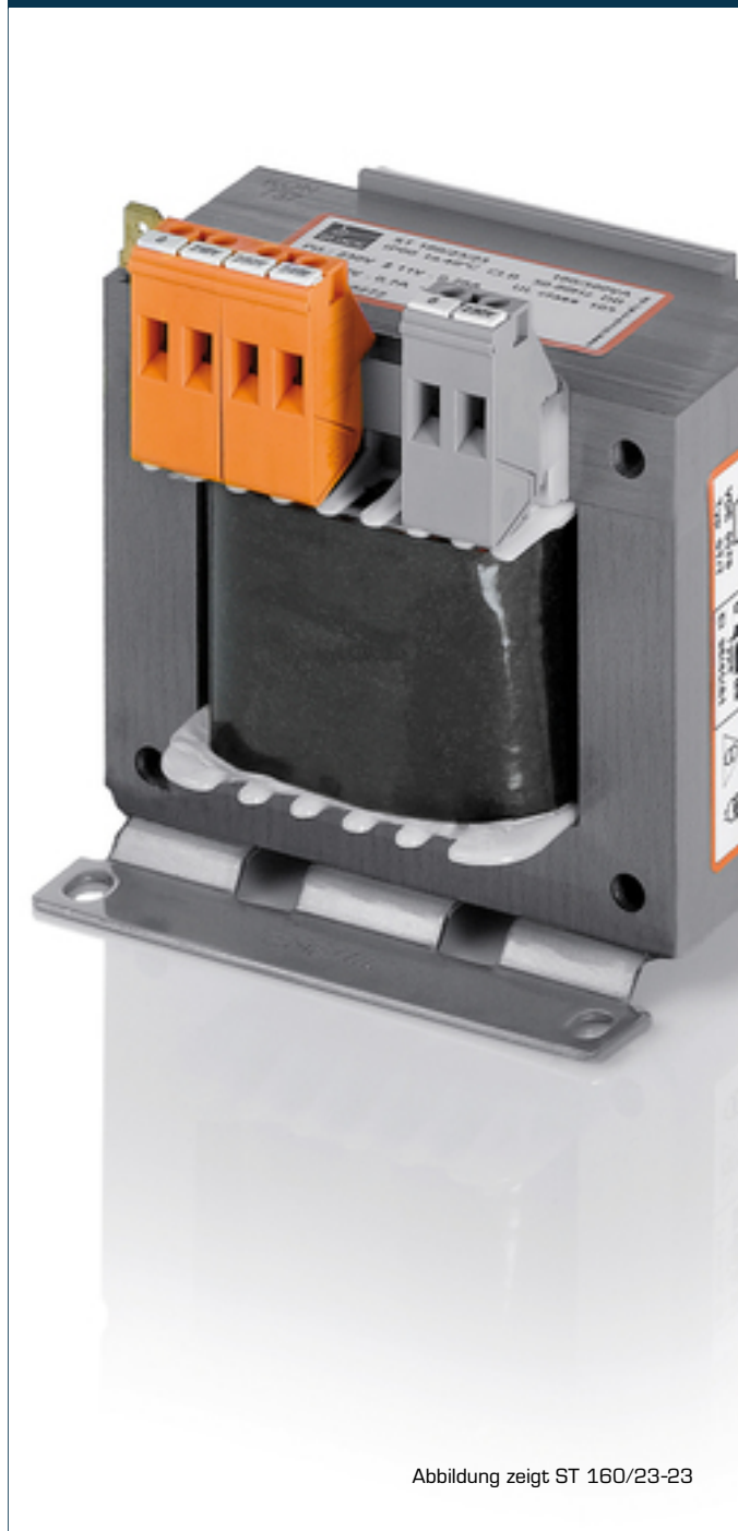
Abbildung zeigt ST 160/23-23