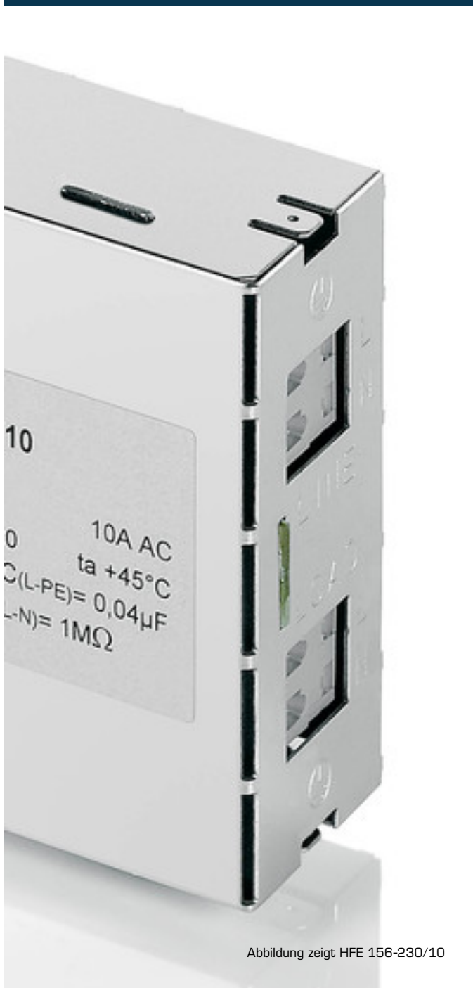
Abbildung zeigt HFE 156-230/10