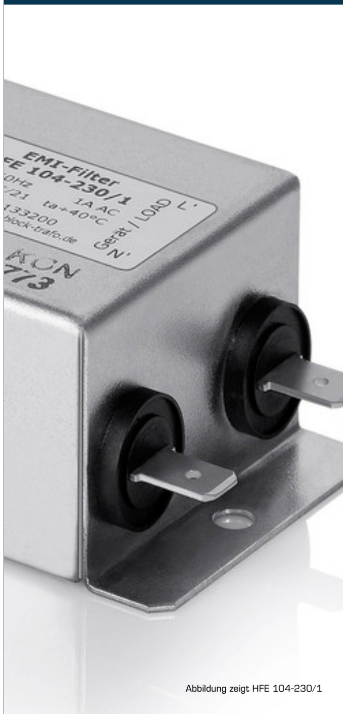
Abbildung zeigt HFE 104-230/1