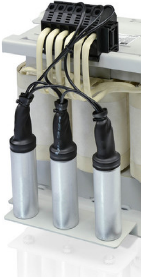
Abbildung zeigt SFB 400/23,5