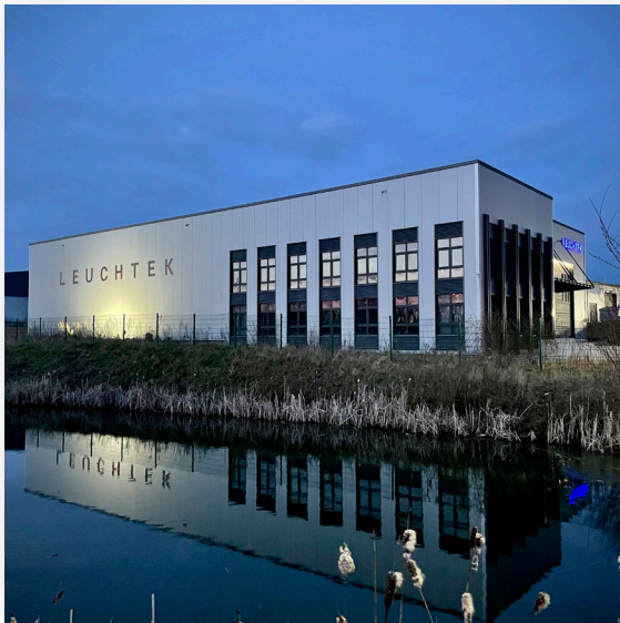
Anwendung: Gebäudebeleuchtung / Sportplätze / Plakatwände